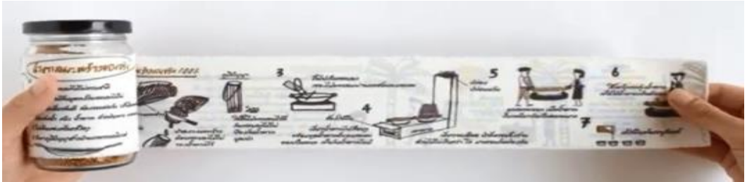
ภาพที่ 2 โครงการอนุรักษ์การทำน้ำตาลมะพร้าวของจริงแบบดั้งเดิมจากภูมิปัญญาชาวบ้านในจังหวัดสมุทรสงคราม ที่มา: โครงการหวานอย่างมีหวัง. (2560).

สรุปว่า การประยุกต์ภูมิปัญญาท้องถิ่นเพื่อสร้างมูลค่าเพิ่มในผลิตภัณฑ์มะพร้าวตามแนวเศรษฐกิจสร้างสรรค์ในระดับชุมชน เน้นการผลิตที่ไม่ได้ใช้เทคโนโลยีขั้นสูง แต่เป็นการผลิตที่ใช้แรงงานเข้มข้น (Labor Intensive) โดยผสมผสานกับภูมิปัญญาท้องถิ่นที่มีอยู่ ดังนั้น รายได้ส่วนใหญ่จึงตกอยู่กับกำลังแรงงาน อีกทั้งก่อให้เกิดผลประโยชน์ทางสังคมด้านทุนทางสังคม (Social Capital) ในลักษณะของการสร้างโอกาสของการมีส่วนร่วมและสร้างระบบความ คิดของการเป็นเจ้าของร่วมกัน มีการพัฒนาสินค้าที่เป็นเอกลักษณ์ของชุมชน นำมาซึ่งการลดรายจ่าย โดยจากการประหยัดทรัพยากรในการผลิต การเพิ่มรายได้จากการมีความสามารถในการสร้างมูลค่าเพิ่ม และ/หรือคุณค่าเพิ่มให้กับผลผลิต และการสร้างโอกาสหรือทางเลือกที่หลากหลายจากผลิตภัณฑ์มะพร้าว