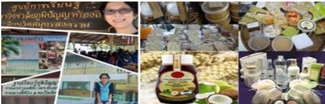
ภาพที่ 1 การท่องเที่ยวเพื่อการเรียนรู้เชิงสร้างสรรค์: การทำน้ำตาลมะพร้าว ที่มา: จากการศึกษา

นอกจากการแปรรูปผลิตภัณฑ์มะพร้าวแล้ว ในชุมชนต่างๆ ของจังหวัดสมุทรสงคราม ได้มีการรวมกลุ่มกันเพื่อการพัฒนาพื้นที่ของชุมชนให้มีศักยภาพในการจัดการท่องเที่ยววิถีไทย การท่องเที่ยวเชิงอนุรักษ์ หรือการท่องเที่ยวเชิงเกษตร เพื่อเปิดโอกาสให้นักท่องเที่ยวเข้ามาสัมผัสวิถีชีวิตชาวสวนและปรัชญาการใช้ชีวิตแบบพอเพียง จัดตั้งเป็นศูนย์การเรียนรู้ภูมิปัญญาท้องถิ่นสมุทรสงคราม หรือพิพิธภัณฑ์มะพร้าว ซึ่งเป็นสถานที่ที่รวมคุณประโยชน์จากมะพร้าวไว้มากมาย