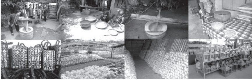
ภาพที่ 1 วัตถุดิบและกระบวนการแปรรูปภูมิปัญญาท้องถิ่นของกิจการวิสาหกิจขนาดย่อม