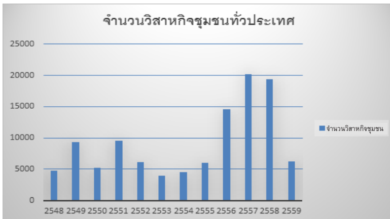
ภาพที่ 3 จำนวนวิสาหกิจชุมชนในประเทศไทยในช่วงปี 2548-2559

จากข้อมูลสถิติจำนวนวิสาหกิจชุมชนในประเทศไทยในปี 2558 ซึ่งเป็นข้อมูล ณ วันที่ 30 ธันวาคม 2558 มีจำนวนทั้งสิ้น 77,890 แห่ง มีจำนวนสมาชิก 1,347,826 ราย มีเครือข่ายวิสาหกิจชุมชน จำนวน 325 แห่ง มีจำนวนสมาชิก 5,523 ราย (Department of Agricultural Extension, 2015) สะท้อนให้เห็นถึงความเชื่อมโยงกันเป็นเครือข่ายของกลุ่มวิสาหกิจชุมชนยังมีน้อย ทำให้ความเข้มแข็งและอำนาจการต่อรองทางการตลาดมีน้อยด้วย อย่างไรก็ตาม ในปี 2559 มีจำนวนวิสาหกิจชุมชนเพิ่มขึ้นเป็น 110,204 แห่ง ถือได้ว่าเป็นแนวโน้มการขยายตัวที่น่าสนใจ ทั้งนี้เมื่อนำข้อมูลการจดทะเบียนเป็นวิสาหกิจชุมชนในช่วง 12 ปีเริ่มตั้งแต่ปี 2548-2559 พบว่าจำนวนวิสาหกิจมีจำนวนเพิ่มขึ้นอย่างมากในช่วงปี 2556-2558 (ภาพที่ 3) ซึ่งในปี 2559 อาจมีแนวโน้มการขยายตัวเพิ่มขึ้นในลักษณะเดียวกัน เนื่องจากข้อมูลที่ปรากฏนั้นเป็นข้อมูล ณ วันที่ 19 มิถุนายน 2559 ซึ่งระยะเวลาที่เหลืออีก 6 เดือนอาจมีการจดทะเบียนจัดตั้งกลุ่มวิสาหกิจชุมชนเพิ่มขึ้น อันเป็นผลมาจากการที่ภาครัฐให้การส่งเสริมและยกระดับสินค้าชุมชนมากขึ้น