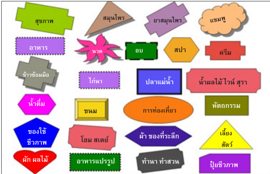
ภาพที่ 2 วิสาหกิจชุมชนขึ้นก้าวหน้า