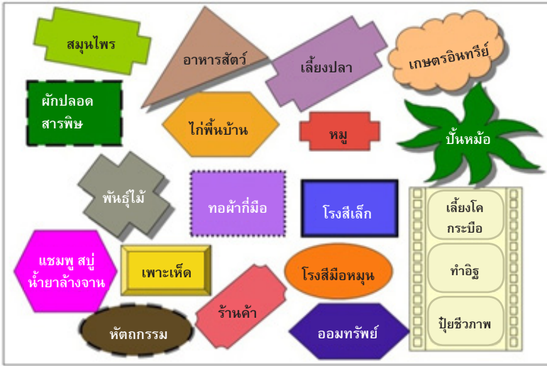
ภาพที่ 1 วิสาหกิจชุมชนขั้นพื้นฐาน

ได้แก่ วิสาหกิจชุมชนขั้นพื้นฐาน เป็นการผลิตเพื่อการอุปโภคและบริโภคในชีวิตประจำวันในชุมชนท้องถิ่นเป็นหลัก (ภาพที่ 1) และวิสาหกิจชุมชนขั้นก้าวหน้า เป็นวิสาหกิจชุมชนที่มีความพร้อมออกสู่ตลาดภายนอกโดยเฉพาะโฮมสเตย์และบริการท่องเที่ยวในชุมชน (ภาพที่ 2) (ตารางที่ 1)