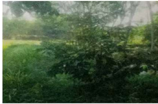
ต้นทุเรียนอายุย่างเข้าปีที่ 2