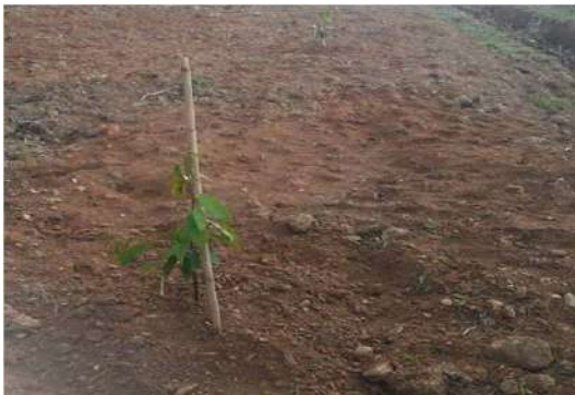
นำทุเรียนปลูกลงหลุมที่เตรียมไว้