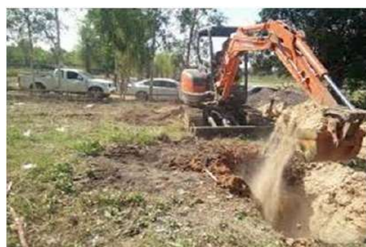
ปรับพื้นที่โดยการใช้แมคโคชุดรอกไม้