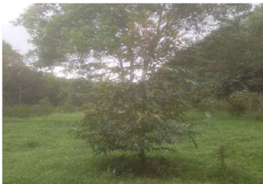
ต้นทุเรียนอายุย่างเข้าปีที่ 3