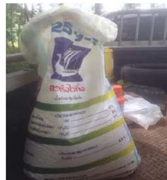
ปุ๋ยทุเรียน สูตร 15-15-15