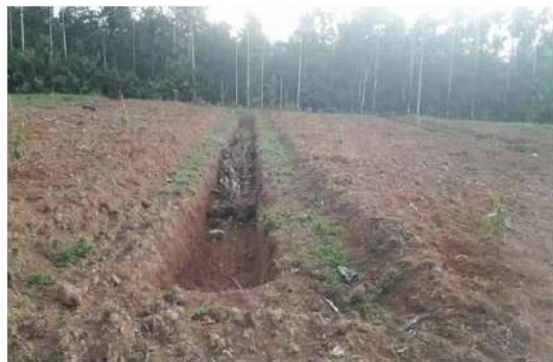
ภาพต้นทุเรียนตลอดระยะแนว