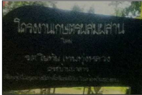
แหล่งเรียนรู้การทำเกษตรแบบผสมผสาน จากคุณลุงประยงค์ ธรรมรงค์ ตำบลไม้เรียง อำเภอลำปาง จังหวัดนครศรีธรรมราช