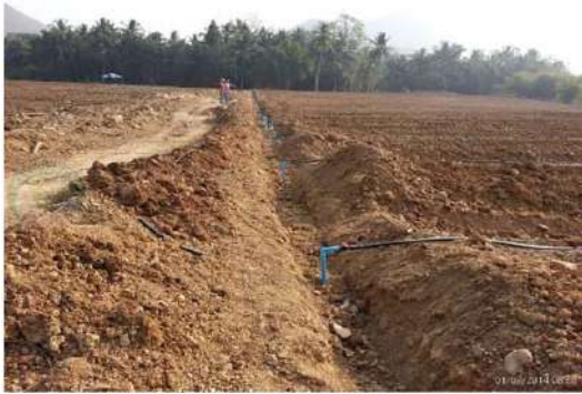
วางท่อเมนระบบน้ำ