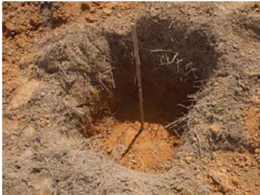
เตรียมหลุมขนาดกว้างลึก 50 x 50 เซนติเมตร