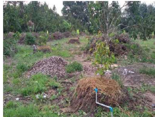
ภาพสวนทุเรียนและภาพกล้วยที่ปลูกแซมไว้