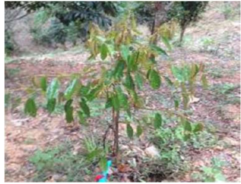
ต้นทุเรียนตอนระยะแรกปลูก