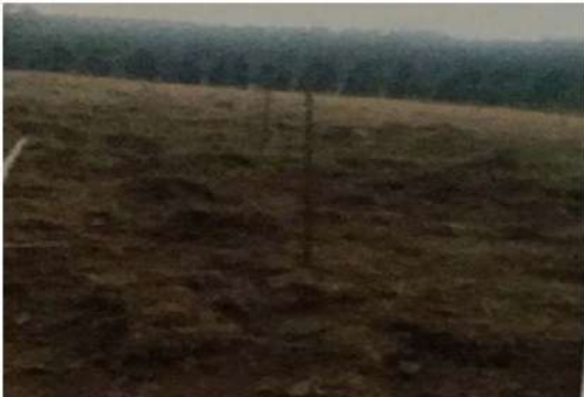
ขั้นตอนการเตรียมดิน