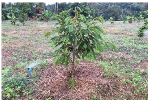
ภาพต้นทุเรียนที่ลงปลูกได้ 1 เดือนแล้ว