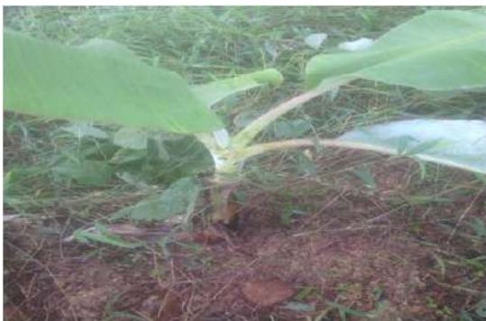
ปลูกลำไยแซมเพื่ออาศัยประโยชน์ร่วมกัน