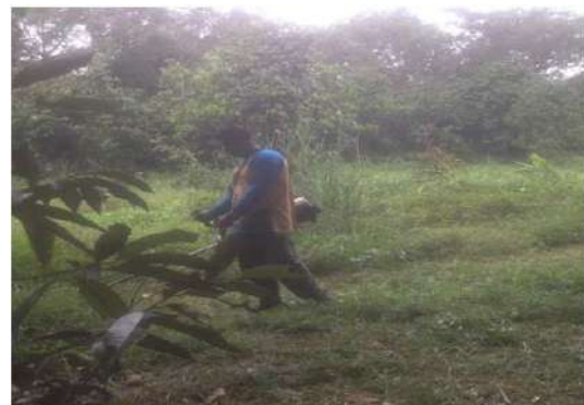
ตัดหญ้าดูแลบำรุงรักษาสวนทุเรียน