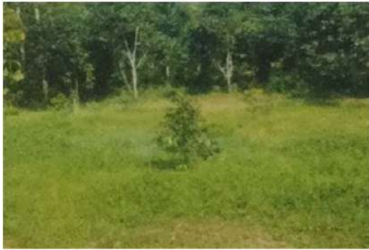
ต้นทุเรียนอายุ 6-7 เดือน