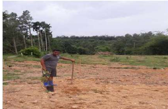
ปักแนวกำหนดจุดปลูก